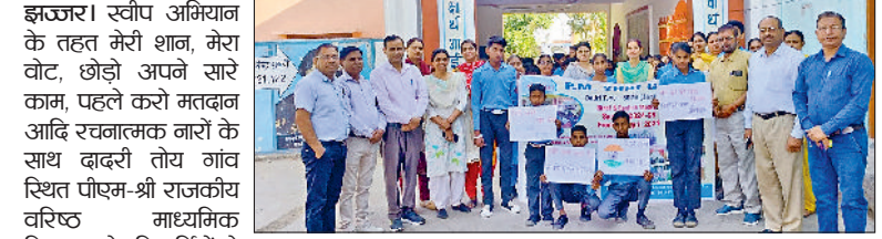
झज्जर। जागरूकता रैली निकालने के दौरान उपस्थित स्कूली विद्यार्थी एवं स्टॉफ सदस्य।