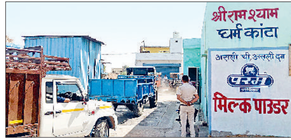
झज्जर। धर्मकांटे पर मामले की जानकारी लेते हुए पुलिसकर्मी।

हवाई फायर करने का मामला सामने आया है। कच्चा बादली रोड स्थित