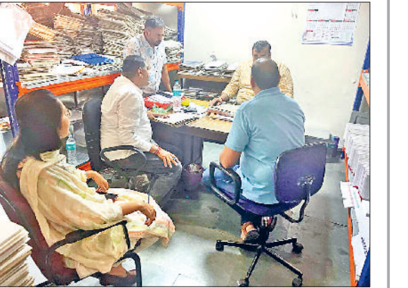
झज्जर। रेड के दौरान रिपोर्ट चेक करते हुए प्रशासनिक अधिकारी एवं सीएम फ्लाइंग की टीम।