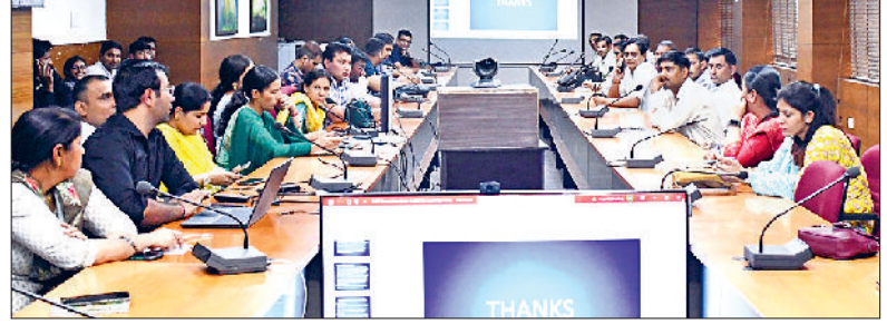
झज्जर। स्वीप ट्रेनिंग कार्यक्रम के दौरान उपस्थित विभिन्न संस्थानों के प्रतिनिधि।