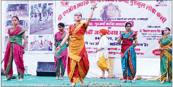
बहादुरगढ़। नाटिका प्रस्तुत करती गुरुकुल की छात्राएं व हैरतअमेज आसन करती गुरुकुल की कन्याएं।